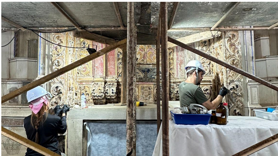
Restauração do retábulo lateral Autoria: Francisco Luz Data: 12/12/2025