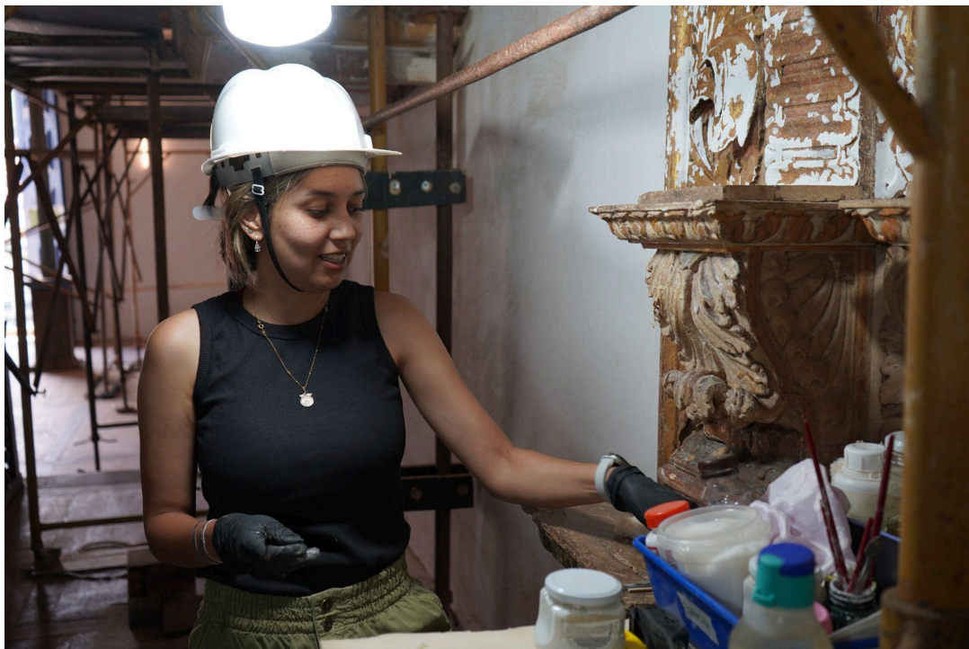
Restauração do retábulo colateral do lado do evangelho Autoria: Francisco Luz Data: 12/12/2025