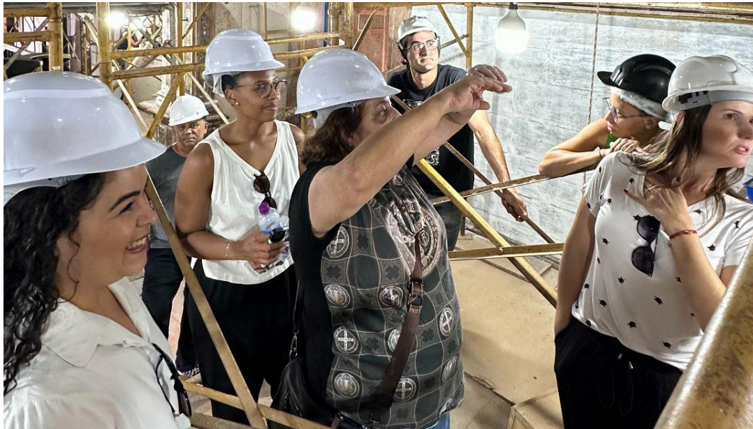
Acompanhamento das atividades de restauração do Retábulo-Mor. Autoria: Francisco Luz Data: 12/12/2025