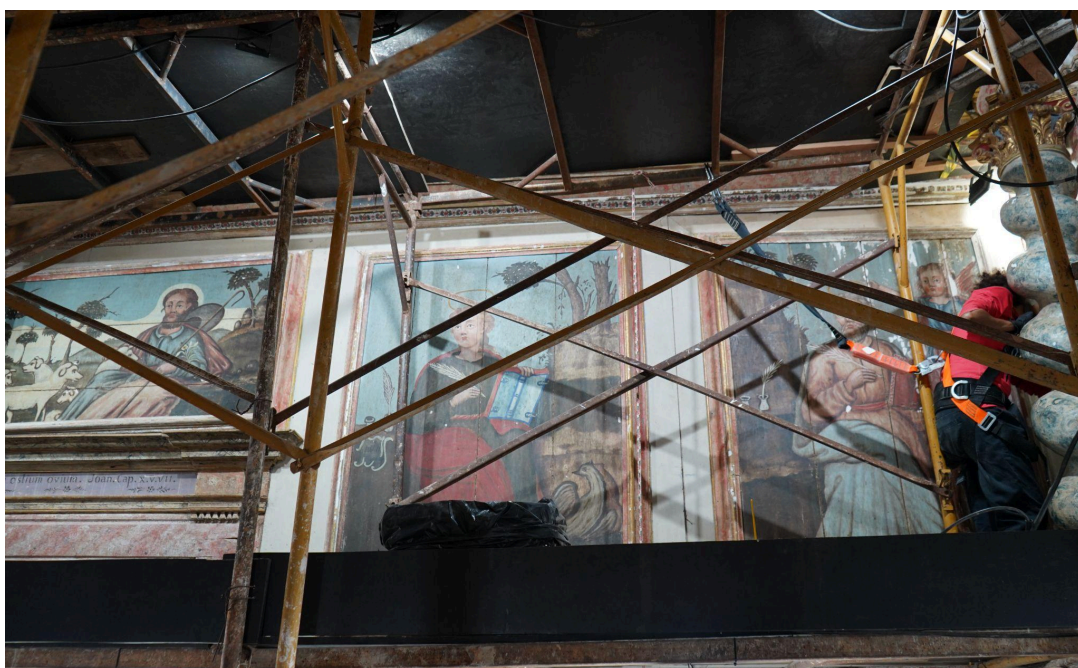
Restauração dos painéis parietais da Capela-Mor Autoria: Francisco Luz Data: 12/12/2025