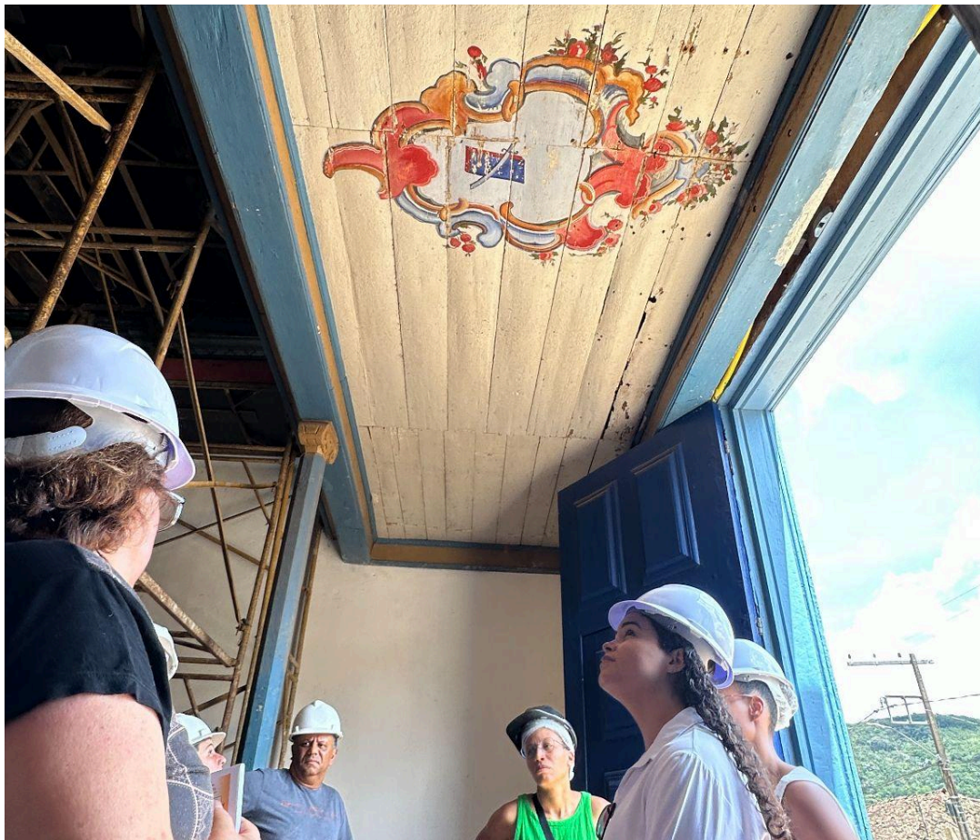
Alinhamentos finais da visita técnica Autoria: Francisco Luz Data: 12/12/2025

Ao final da visita, constatamos que o projeto está em andamento e que as atividades estão sendo executadas conforme o previsto e satisfatoriamente recebidas pelos participantes.