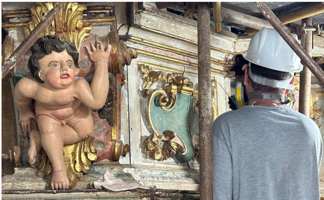
Retábulo-Mor: atividades de higienização mecânica, higienização química Autoria: Francisco Luz Data: 12/12/2025