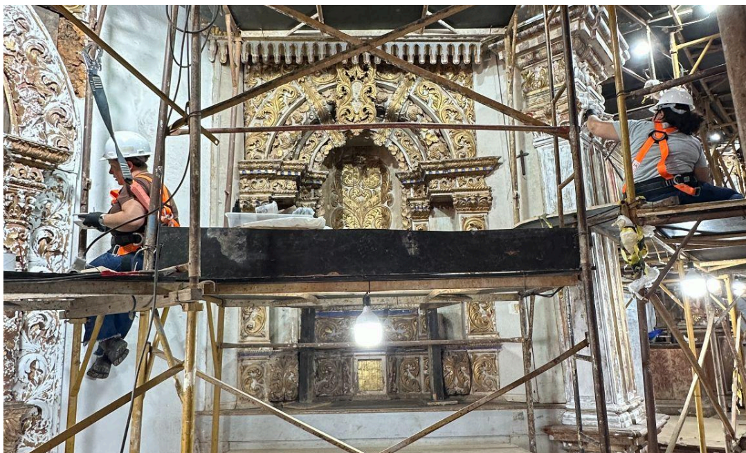
Restauração do retábulo colateral do lado da epístola Autoria: Francisco Luz Data: 12/12/2025