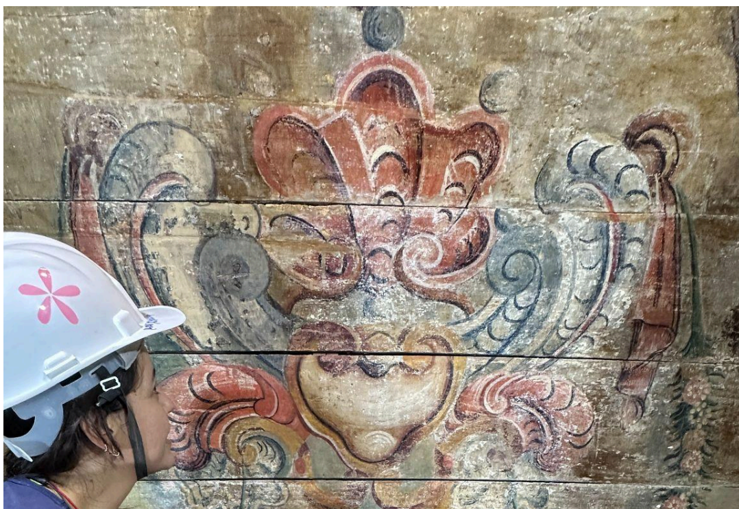
Retábulo-Mor: fixação da policromia e remoção da repintura do forro do camarim Autoria: Francisco Luz Data: 12/12/2025