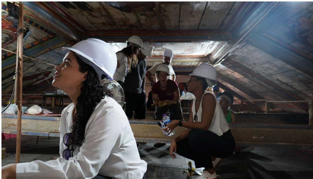
Restauração do forro da nave