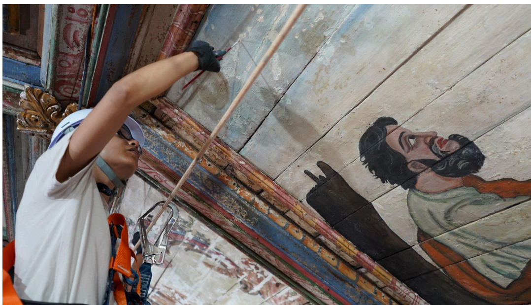
Restauração do forro da nave Autoria: Francisco Luz Data: 12/12/2025